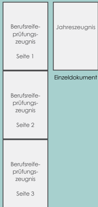
Alle Seiten zu einem PDF zusammenfügen